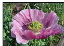
DT 321 AIRSAN OPIUM Fragranza OPIUM