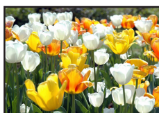
DT 008 AIRSAN SPECIAL Fragranza FIORI