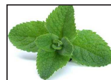
DT 105 AIRSAN MINT Fragranza MENTA