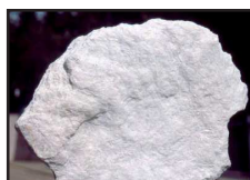
DT 320 AIRSAN TALCO Fragranza TALCO