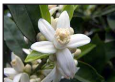
DT 322 AIRSAN ZAGARA Fragranza ZAGARA