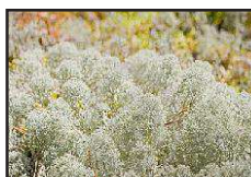
DT 319 WHITE MUSK Fragranza MUSCHIO BIANCO