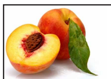
DT 007 AIRSAN FRUIT Fragranza PESCA

Indicato in tutti gli ambienti di accoglienza di alberghi, aziende, uffici e nei locali dove si hanno cattivi odori o lento ricambio d'aria quali: palestre, spogliatoio, sale riunioni, camere d'albergo, bagni con odori di reflusso dagli scarichi, settore funebre etc. Idoneo anche per pot-pourri.