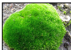
DT 315 AIRSAN MUSK Fragranza MUSCHIO