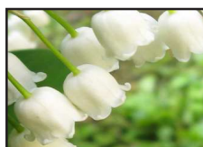
DT 104 AIRSAN LILY Fragranza MUGHETTO