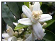
DT 322 AIRSAN ZAGARA Fragranza ZAGARA