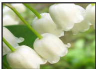
DT 104 AIRSAN LILY Fragranza MUGHETTO