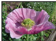
DT 321 AIRSAN OPIUM Fragranza OPIUM