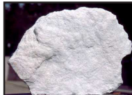
DT 320 AIRSAN TALCO Fragranza TALCO