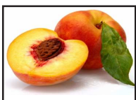
DT 007 AIRSAN FRUIT Fragranza PESCA

Indicato in tutti gli ambienti di accoglienza di alberghi, aziende, uffici e nei locali dove si hanno cattivi odori o lento ricambio d'aria quali: palestre, spogliatoio, sale riunioni, camere d'albergo, bagni con odori di reflusso dagli scarichi, settore funebre etc. Idoneo anche per pot-pourri.