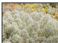
DT 319 WHITE MUSK Fragranza MUSCHIO BIANCO