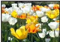
DT 008 AIRSAN SPECIAL Fragranza FIORI