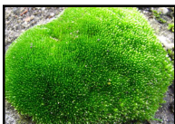
DT 315 AIRSAN MUSK Fragranza MUSCHIO